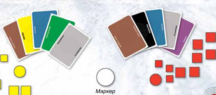
Маркер первого игрока