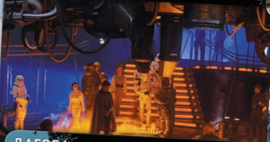
КАМЕРА ЗАМОРОЗКИ В КАРБОНИТЕ