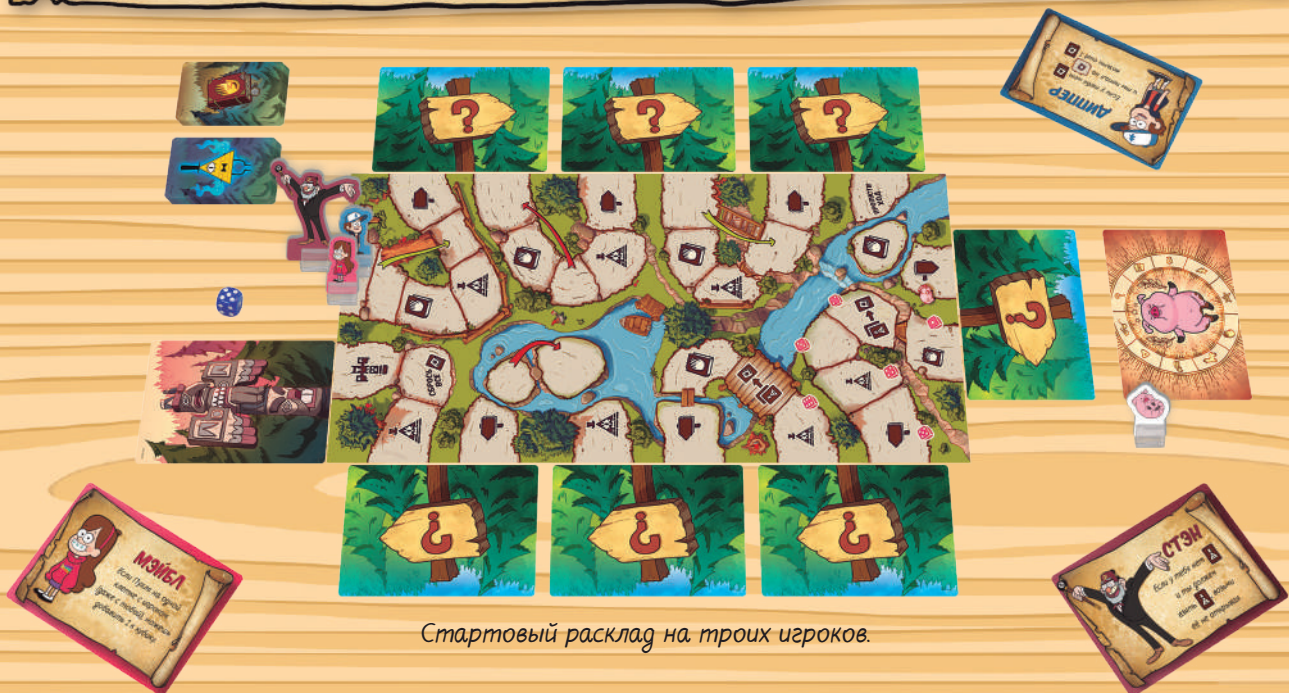
Стартовый расклад на троих игроков.