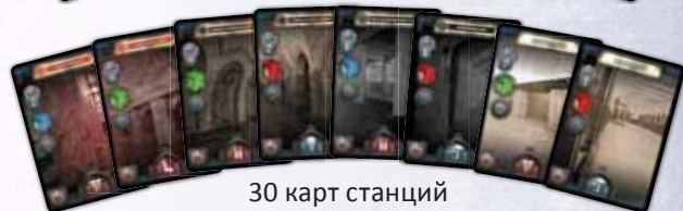
30 карт станций