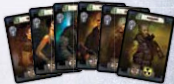
6 карт героев