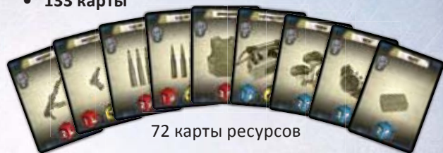
72 карты ресурсов