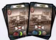
6 карт караванов