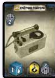
Обычная карта ресурса

Карту ресурса можно разыграть другим способом: как защиту (если есть). Если вы решили сыграть карту ресурса как защиту, разверните её на 180 градусов. Заплатив её стоимость, выложите карту перед собой. Теперь она даёт вам защиту от некоторых типов угроз: обозначены символами в жёлтых щитах.