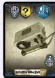
Карта ресурса, выложенная на защиту

ВАЖНО: если вы сыграли карту ресурса как защиту, она не будет приносить вам ресурсов для выполнения задания.