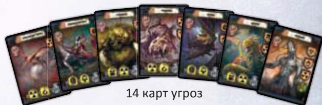
14 карт угроз