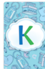
Памятка Лицевая сторона Рубашка